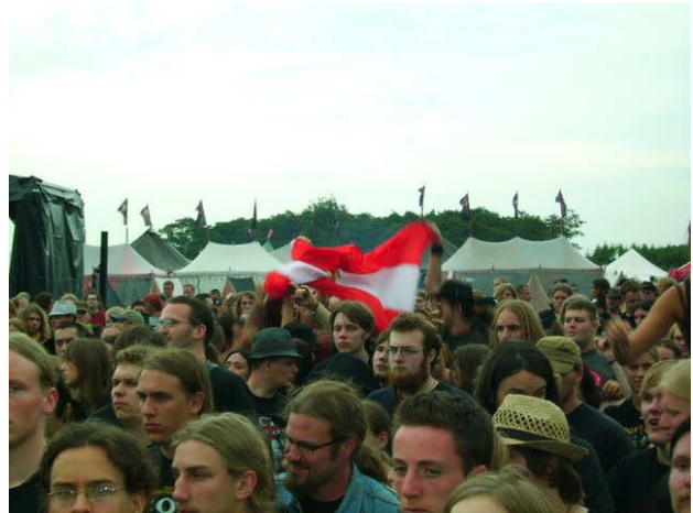
The Ö-Factor. (rechts)